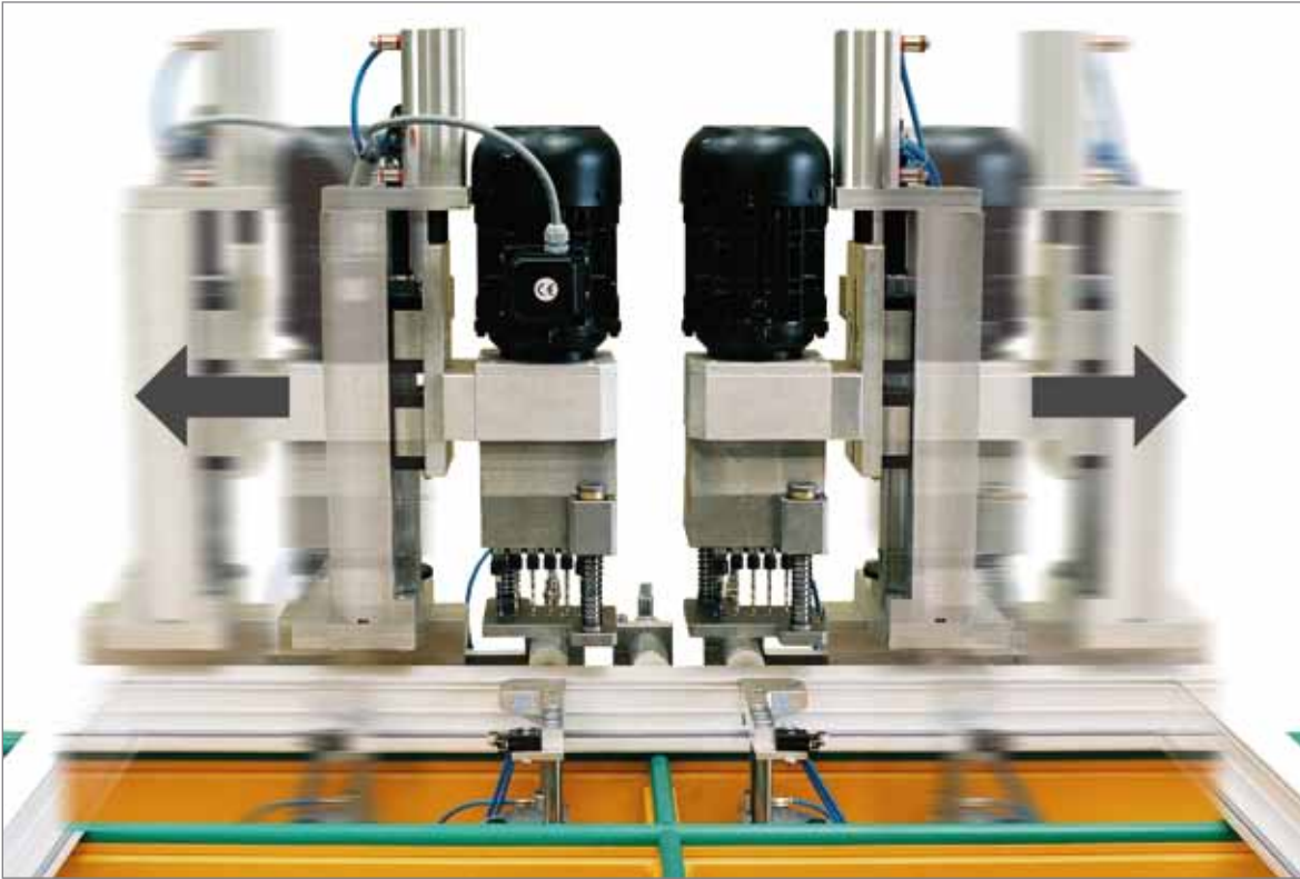
Неповорачиваемые сверлильные агрегаты (при сверлении отверстий только в рамах), либо поворотные (при сверлении отверстий в рамах и импостах)